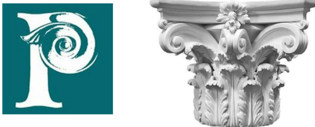
Рисунок 3. Логотип училища имени Н. К. Рериха [2]

Логотип училища представляет собой стилизованную заглавную букву «Р», совмещенную с декоративным элементом, визуально напоминающим орнамент в стиле архитектуры модерна, – характерными скругленными, природными линиями. Логотип – это графическое изображение или символ, который представляет собой уникальную идентификацию бренда, компании или продукта. Символически логотип отсылает к имени самого Н. К. Рериха, имя которого было присвоено училищу в 1992 году. Элемент, напоминающий архитектурную деталь, может быть интерпретирован как отсылка к классическому академическому образованию. Сопоставление логотипа и архитектурного элемента представлено на рисунке 3.