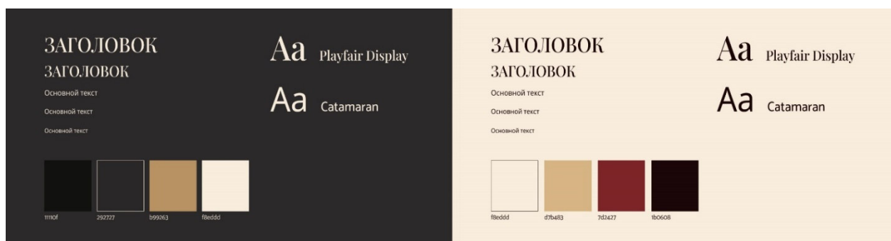
Рисунок 5. Варианты цветовых решений и шрифтовых пар

Были разработаны два варианта цветовых решений. В первом преобладает черный, желто-коричневый для выделения важных элементов и кнопок. Такой выбор цветов создает сдержанную и сосредоточенную атмосферу, которая подходит для официальной подачи.