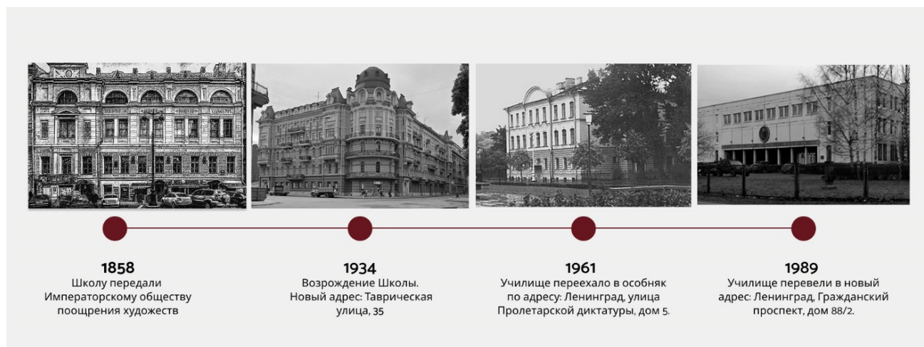
Рисунок 2. Хронология изменения расположения училища

Художественное училище имени Н. К. Рериха имеет богатую историю, восходящую к Школе Императорского общества поощрения художников. Училище оказало значительное влияние на развитие отечественного и мирового искусства – здесь учились или преподавали выдающиеся художники, среди которых И. Репин, М. Шагал, Ф. Васильев и многие другие известные личности.