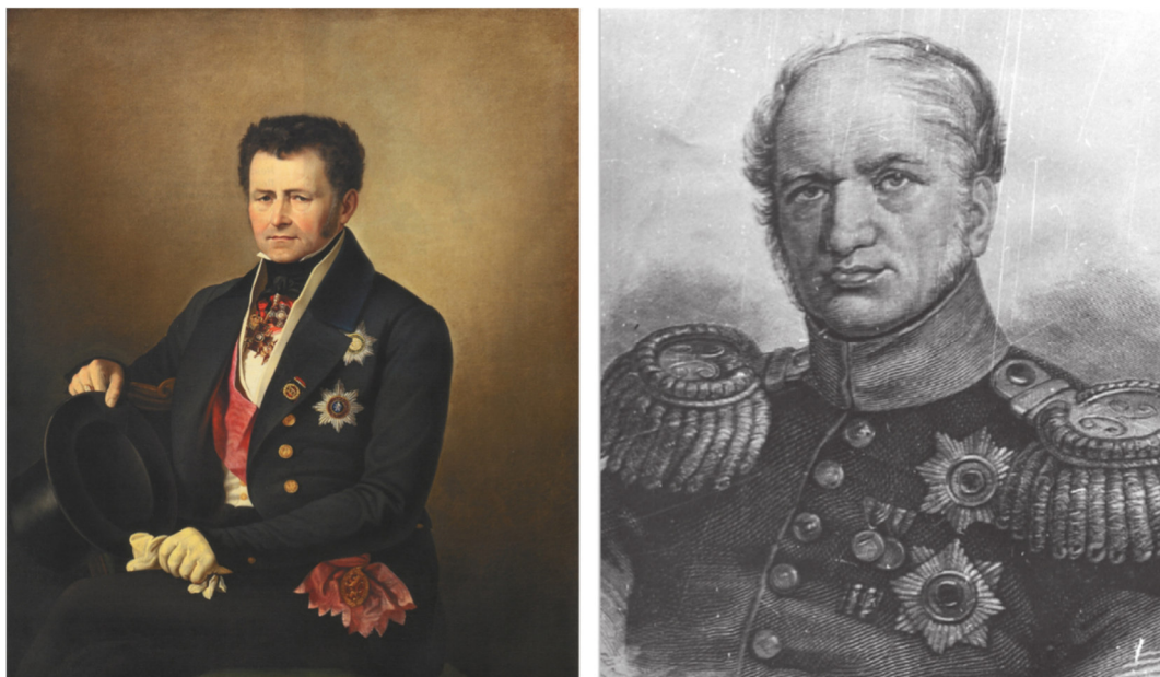
Рисунок 1. Основатели Рисовальной школы для вольноприходящих К. Х. Рейссиг и Е. Ф. Канкрин [6, 7]

Училище было основано в 1839 году в соответствии с Указом Государя Императора Николая Первого. Открытие в Петербурге специальной Рисовальной школы для вольноприходящих учеников связано с именами «русских немцев» – Е. Ф. Канкрина, на тот момент министра финансов Российской империи, и К. Х. Рейссига, видного ученого, которого также следует назвать теоретиком и организатором художественного образования. Организации Рисовальной школы предшествовало появление нескольких учебных классов, возникновение которых также инициировали Канкрин и Рейссиг. «Рисовальная Школа для вольноприходящих» или «Рисовальная Школа на Бирже», как её называли в соответствии с местом расположения на Стрелке Васильевского Острова, предоставляя бесплатное художественное образование для всех желающих [3–5].