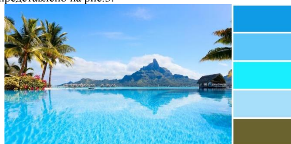
Рис. 3. Изображение лета, выбор большинства мужчин.

Наиболее повторяющееся изображение для всех типов темперамента при проведении свето- и цвето- терапии в качестве изображения на панели светового панно представлено на рис.3.