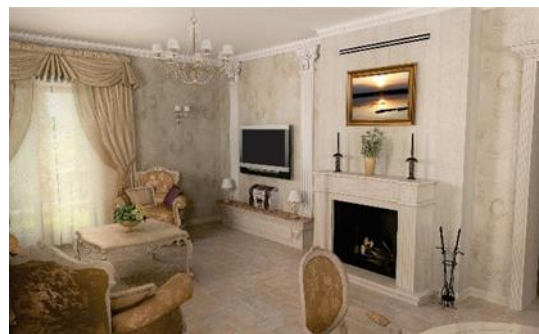
Рис. 6. Интерьерное решение с использованием светильника для арт-терапии.

Кроме перечисленных помещений сеансы светотерапии и цветотерапии предлагается использовать комплексно с физическими занятиями на реабилитационных тренажерах. Люди, перенесшие инсульт, инфаркт, тяжелые травмы и операции часто находятся в состоянии депрессии, это состояние не способствует эффективной реабилитации. Для улучшения эмоционального состояния данную задачу предлагается решить с помощью светового панно [7].