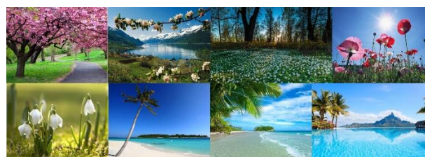
меланхолик – синий цвет

Примеры набора изображений для светотерапии приведены на рис. 5.