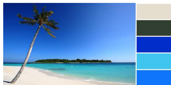
Рис. 4. Изображение лета, выбор большинства женщин.

Примеры набора изображений для светотерапии приведены на рис. 5.