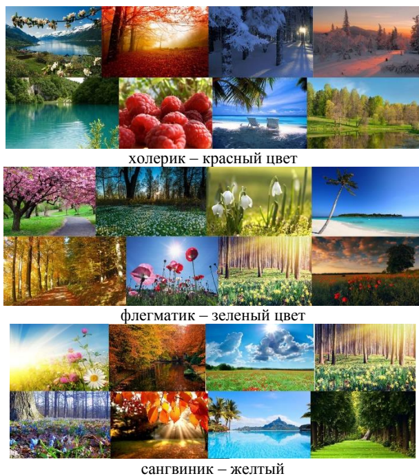
Рис. 5. Изображения для светотерапии.