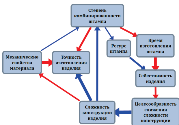
Рис. 1. Основная метафора