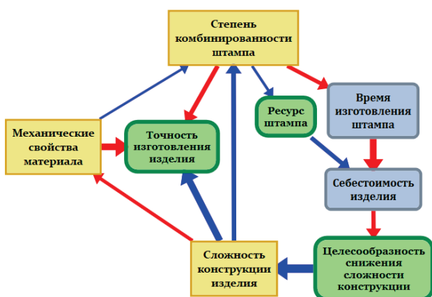
Рис. 2. Метафора разделения концептов по типам