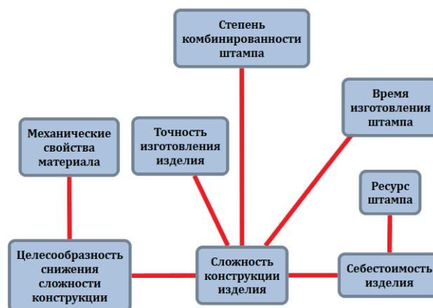
Рис. 4. Метафора альфа-среза по взаимовлиянию