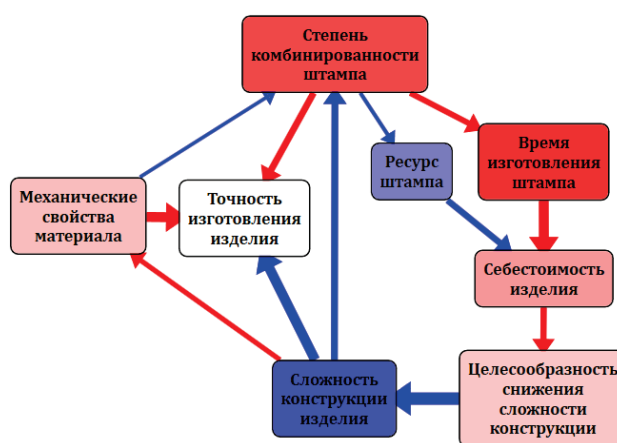
Рис. 3. Метафора влияния концептов на систему