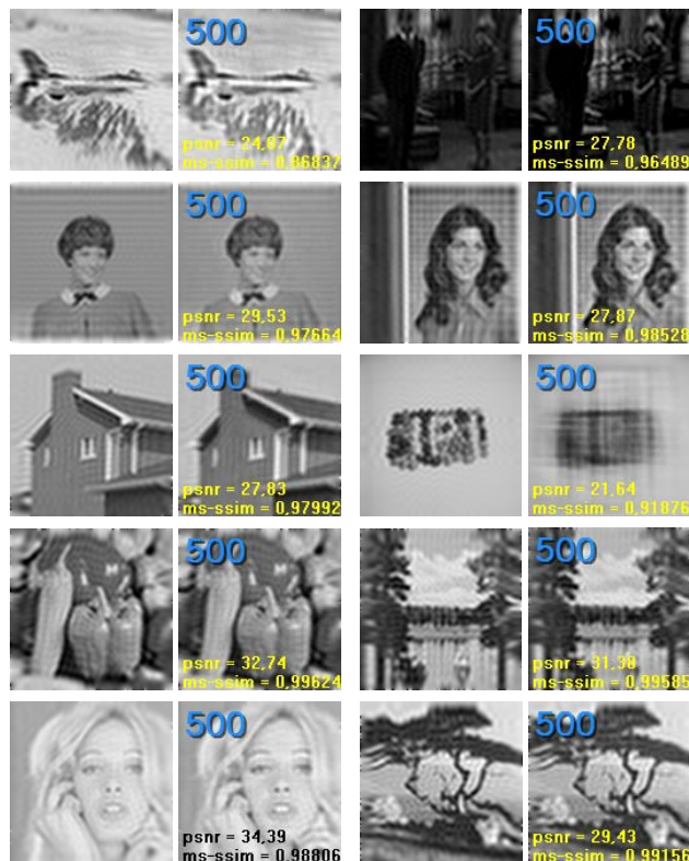
Рис. 4. Результаты работы алгоритма

Для тестирования работы алгоритма рассмотрим изображения из базы данных SIPI Miscellaneous [20] размера 128×128 пикселей. На рис. 4 приведены аппроксимации изображений из базы данных и изображения после 500 итераций, а также значения метрик PSNR и MS-SSIM между изображениями.