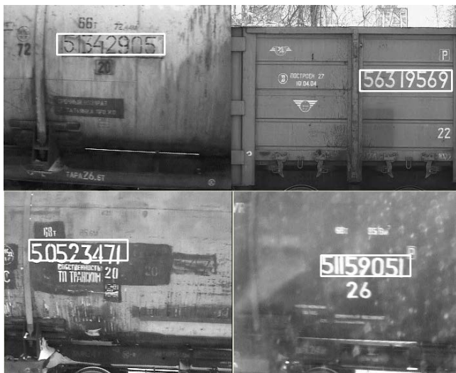
Рис.4. Примеры работы алгоритма обнаружения номерных знаков железнодорожного подвижного состава.

Примеры работы алгоритма обнаружения номерных знаков на основе обученного каскадного классификатора показаны на рис.4.