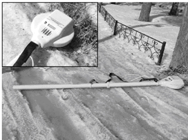
Рис. 1. Аппаратура электромагнитного индукционного частотного зондирования ЭМС

В настоящее время в лаборатории электромагнитных полей Института нефтегазовой геологии и геофизики СО РАН (г. Новосибирск) ведется разработка аппаратурно-программного комплекса электромагнитного индукционного частотного зондирования (ЭМС). Наземный переносной аппаратурно-программный комплекс ЭМС предназначен для дистанционного исследования объемного распределения удельной электропроводности верхнего слоя почвы на глубинах до 7 метров.