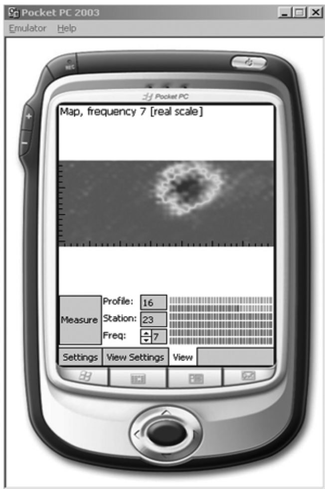
Рис. 2. Эмулятор платформы Pocket PC 2003

Программно-аппаратурным комплексом ЭМС в начале февраля 2006 г. были выполнены комплексные исследования на части площади кальдеры вулкана в окрестностях города Латера (провинция Лацио, Италия).