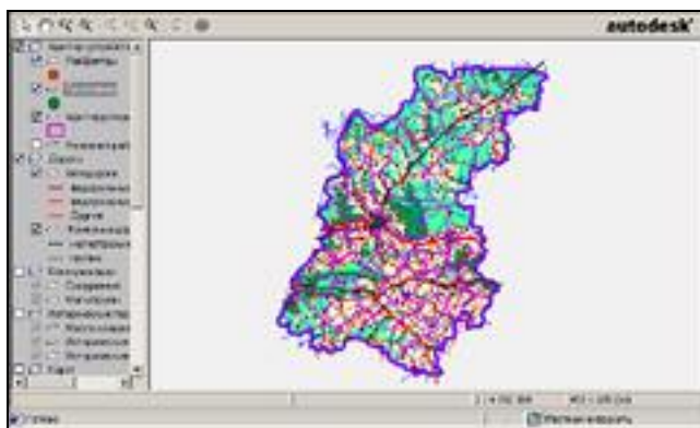
Рис 1: Стандартный вид окна MapGuide Viewer

Autodesk MapGuide Viewer предоставляет пользователю возможности, заметно уступающие возможностям настольных ГИС, как в части навигации по карте, так и в отображении атрибутивной информации. Стандартный вид окна MapGuide Viewer представлен на рис. 1.