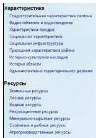
Рис 5: Сформированный список атрибутивных данных для объекта на карте

Для проектирования ГИС на платформе Autodesk MapGuide была разработана система поддержания и обновления атрибутивных данных через MS Access. Актуальность разработки состоит в том, что рядовой персонал, изменяющий атрибутивные данные системы, может не осваивать языка HTML, на котором построена система. Разработчик ГИС формирует ряд таблиц в MS Access, описывающих название документа, функциональную группу документа, а также путь к файлу документа на сервере. Далее, модифицируя эти таблицы, пользователи формируют атрибутивные данные системы. При просмотре характеристик картографического объекта в MapGuide Viewer, разработанным модулем формируется список документов, описывающих объект. Данный список содержит ссылки на сгруппированные документы. Вид формируемого списка приведен на рис.5.